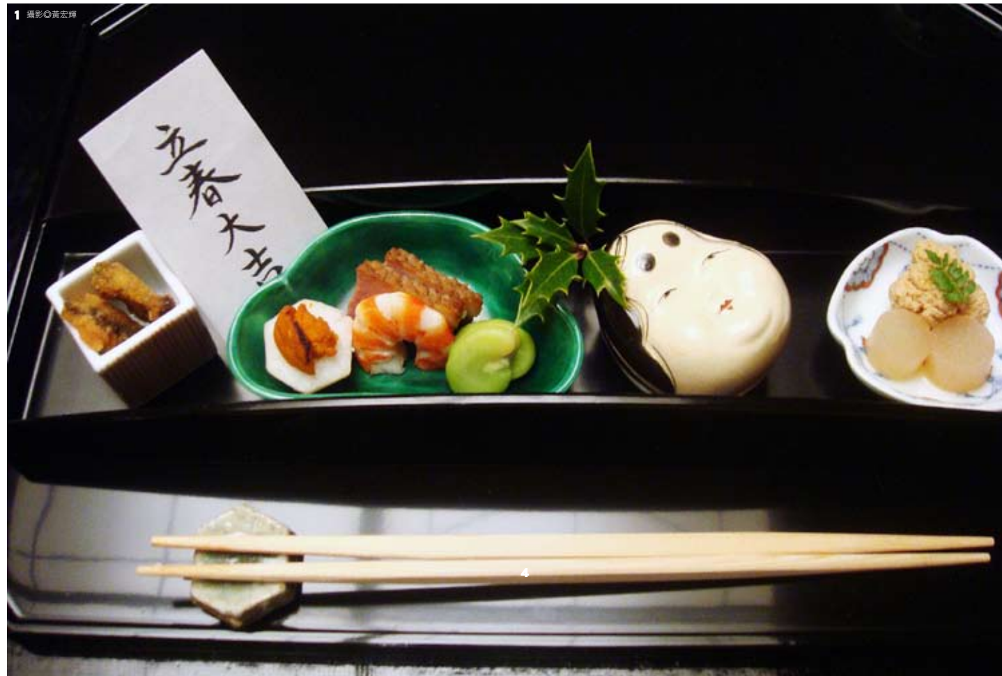
1.前菜以立春大吉表示去冬迎春。2.木造表情讓建築柔化。3.隨處的觀景休憩室。4.閑院宮家和洋建築氛圍。5.江戶時期洋式花窗。6.古蹟木格扇的懷舊氛圍。

強羅花壇 Add/ 神奈川縣足柄下郡箱根町強羅1300 Tel/+81-460-82-3331 Web/www.gorakadan.com E-mail/info@gorakadan.com